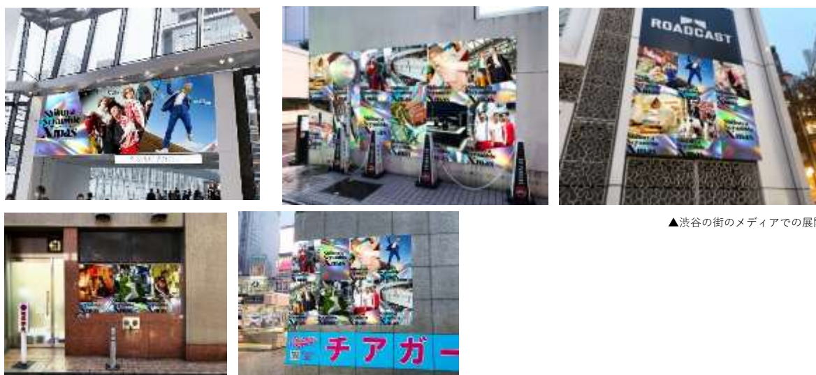
▲渋谷の街のメディアでの展開

渋谷のさまざまな場所で撮影をおこなったビジュアルを、渋谷の街のメディアへ露出を行うことで、渋谷の街全体に活気を与える展開を行います。