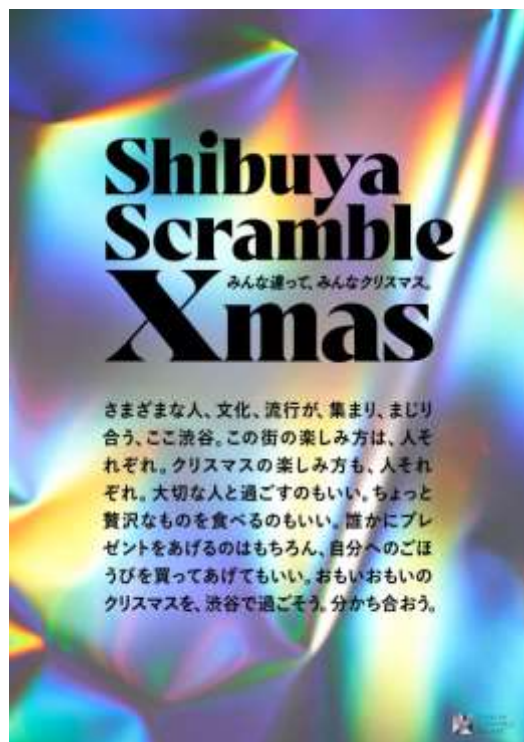
▲ステートメントビジュアル