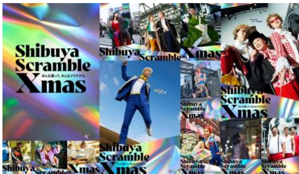
▲Shibuya Scramble Xmas ビジュアル

本フェアのテーマは「みんな違って、みんなクリスマス。」。新型コロナウイルス感染拡大防止のため、さまざまな制約がある中でも、クリスマスを楽しむことを肯定する発信を行いたいという思いのもと、年齢、性別、国籍にとらわれない、多様な方々のクリスマスの楽しみ方を表現することで、お客さまがおもしろおもしろのクリスマスを楽しみ、過ごすことの価値を感じられるクリスマスフェアを目指します。