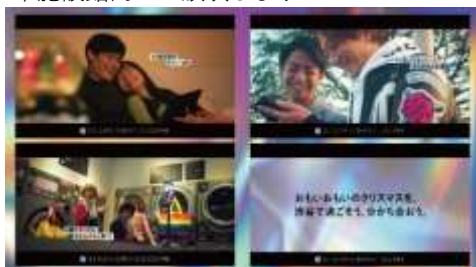
▲Special Movie サムネイル