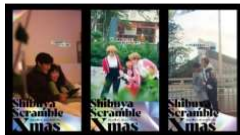
▲縦型 Movie サムネイル