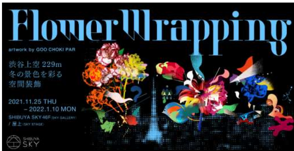
▲メインビジュアル

日々渋谷を利用される方も、観光で渋谷を訪れる方も、SHIBUYA SKY のこの時期だけの特別な空間の中、日常から解き放たれ、素敵なひとときをお楽しみください。