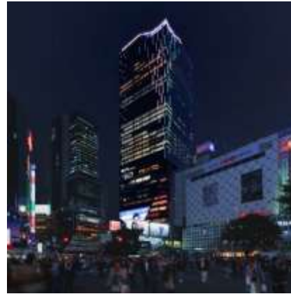
▲渋谷スクランブルスクエアのビル LED 照明